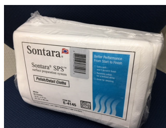
E-4145 SPS ポリッシュ/ディティールクロス

磨き仕上げにご利用いただける 最終拭き取り用クロスです 31.0x43.0Cm ホワイト 50枚入り/袋