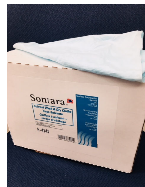
E-4143 ソルベント ウオッシュ&ドライクロス

磨き仕上げにご利用いただける 最終拭き取り用クロスです 31.0x43.0Cm ホワイト 50枚入り/袋