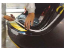
柔軟性で様々な形状のプレスラインに対応！ 適度な粘着性のノリを採用しています 耐熱温度95℃で乾燥も安心