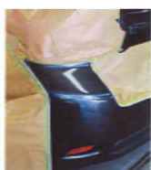
マスキング作業がぐっと 簡略化できます