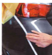
バンパー凸部ラインにも ピッタリフィット