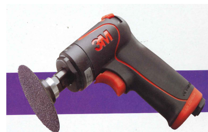
3M 33577 ロックサンダー